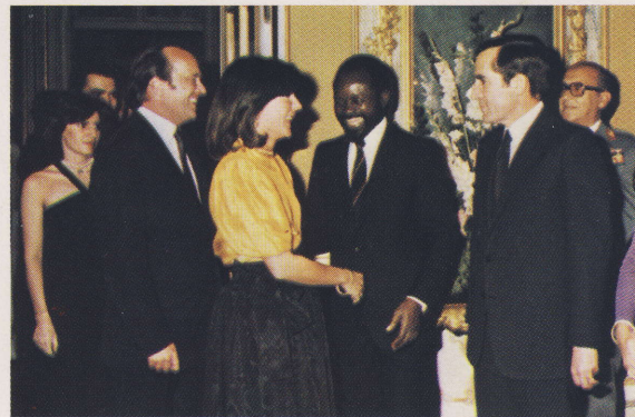
O presidente Samora Machel recebe o Dr. Pinto Balsemão e esposa, no Palácio de Queluz.

The ministers of Foreign Affairs of Portugal and Mozambique during a working conference.