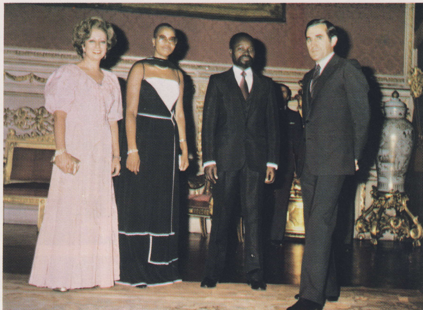
Da esquerda para a direita: Manuela Eanes, Graça Machel, Samora Machel e Ramalho Eanes.

The President of Mozambique with Mota Pinto, the Vice-Prime Minister and Minister of Defense.