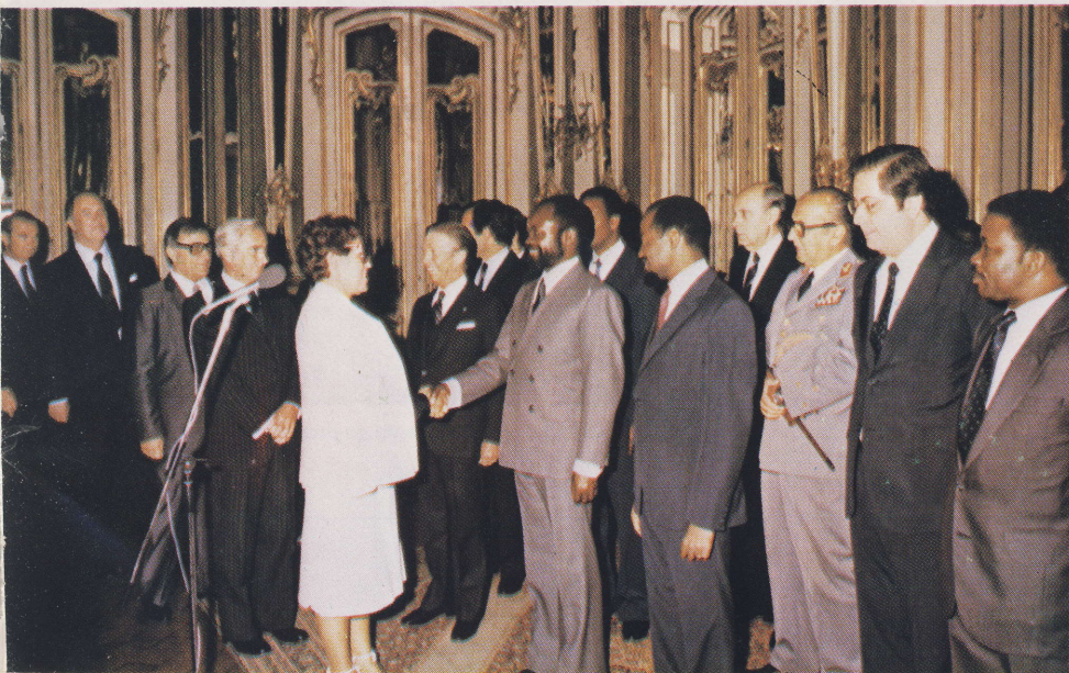
Apresentação de cumprimentos no Palácio de Queluz

During a lunch reception given by the Prime Minister in Sintra.