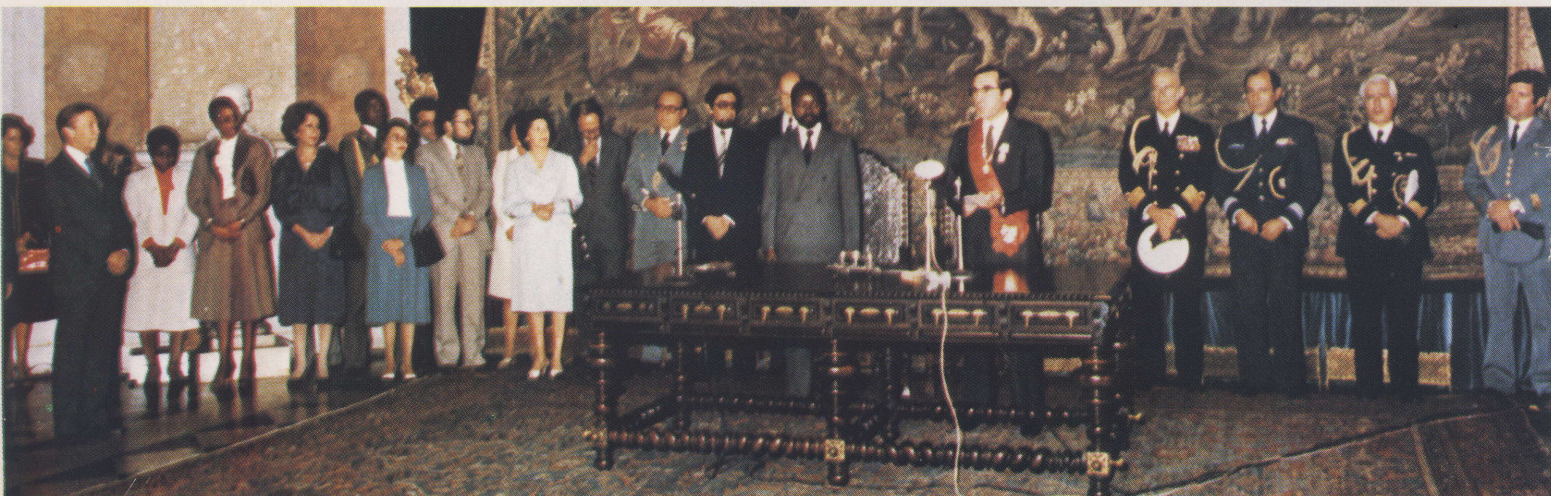
O General Ramalho Eanes, condecorado por Samora Machel com a Ordem da Amizade e Paz — 1.º Grau, agradece a distinção ao presidente moçambicano.

The two Presidents and their wives. At the back can be seen Eng. Tito de Morais, President of the Parliament and his wife.