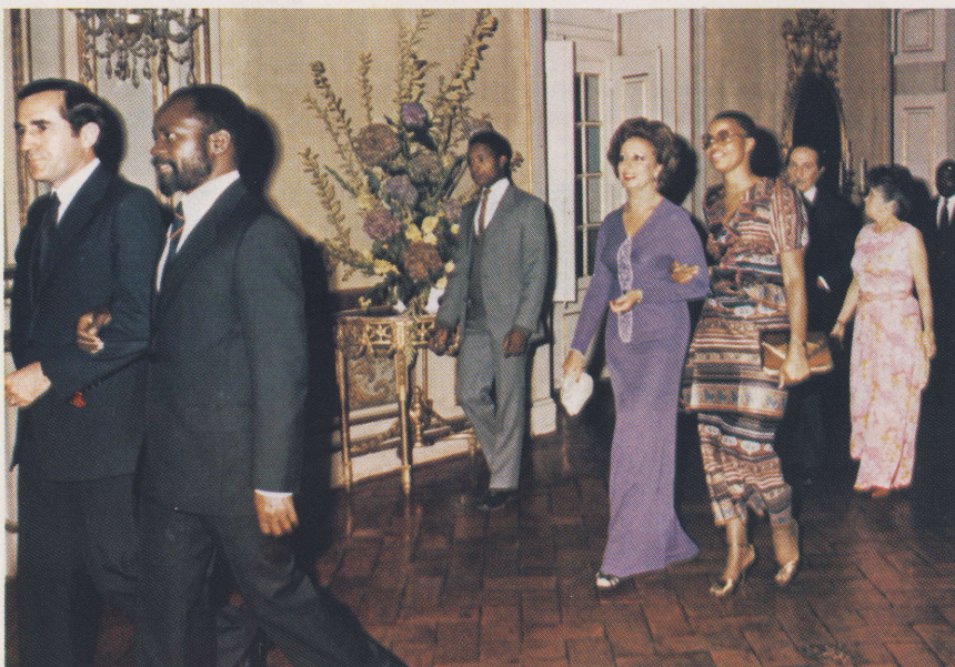
Os dois presidentes e esposas no Palácio de Queluz. À direita, o Eng. Tito de Morais, Presidente da Assembleia da República, e esposa.

Welcoming Dr. Pinto Balsemão, the ex-Prime Minister and his wife at Queluz Palace.