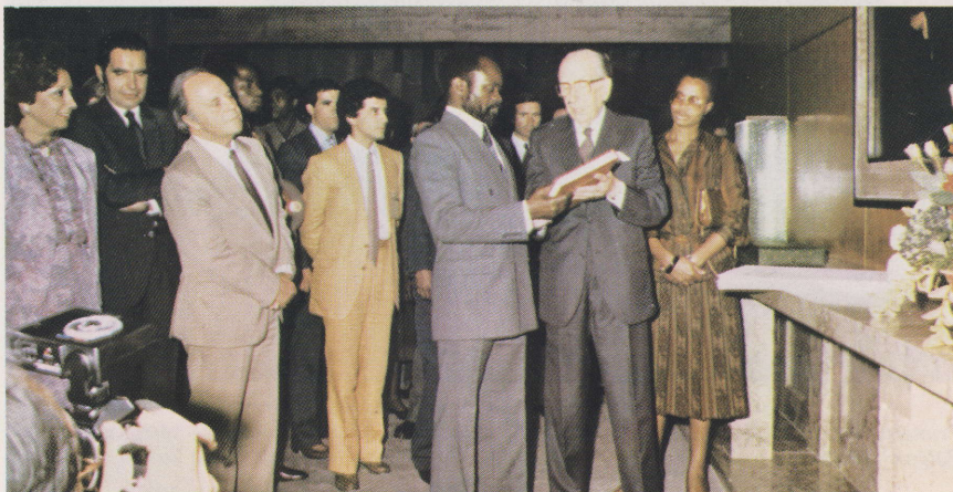
Samora Machel com a Eng. Lurdes Pintassilgo — um largo sorriso.

The President of Mozambique and Eng. Lurdes Pintassilgo, the ex-Prime Minister, warmly complimenting each other.