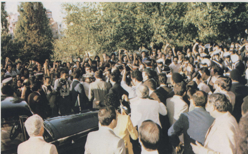
Um grande entusiasmo popular envolveu toda a visita do presidente moçambicano.

Samora Machel giving a speech with President Eanes and Prime Minister Soares, at the lunch ceremony given by Portuguese businessmen.