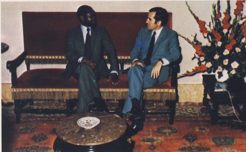
Primeiro encontro dos dois presidentes no Palácio de Belém

At the airport conversing, Graça Machel wife of the President of Mozambique, with the first lady Manuela Eanes and Maria Barroso, wife of the Portuguese Prime Minister