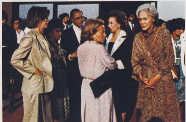
Graça Machel na sala dos VIP's com a Dr. Manuela Eanes e Maria Barroso

At the airport conversing, Graça Machel wife of the President of Mozambique, with the first lady Manuela Eanes and Maria Barroso, wife of the Portuguese Prime Minister