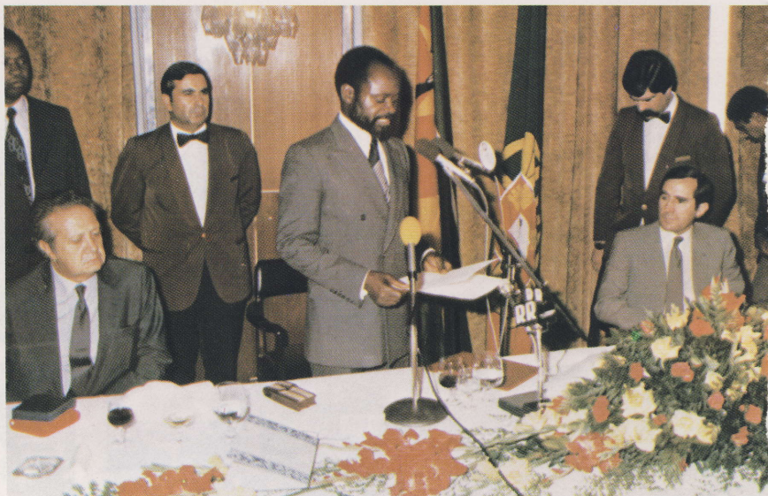
Machel discursa durante o almoço que lhe foi oferecido por empresários portugueses, ladeado por Ramalho Eanes e Mário Soares.