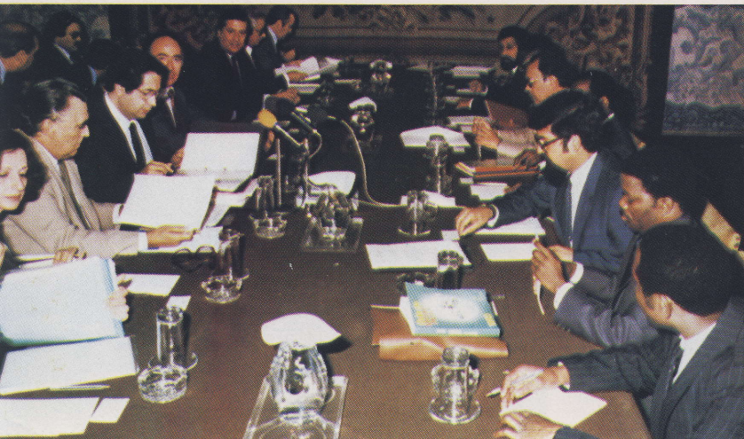
Os ministros dos Negócios Estrangeiros de Portugal e Moçambique, Jaime Gama e Joaquim Chissano respectivamente, presidem a uma sessão de trabalhos.

The ministers of Foreign Affairs of Portugal and Mozambique during a working conference.