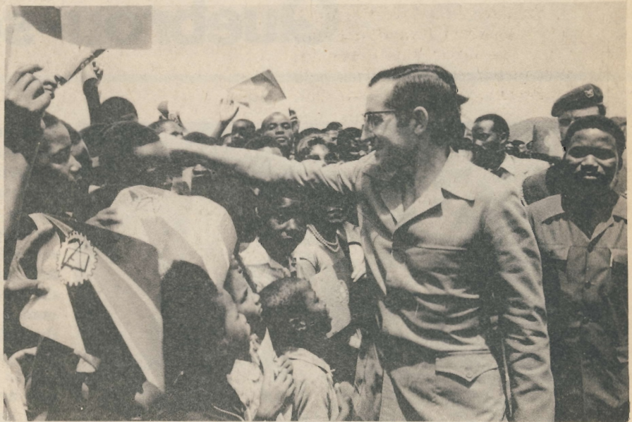
Chegada a Tete