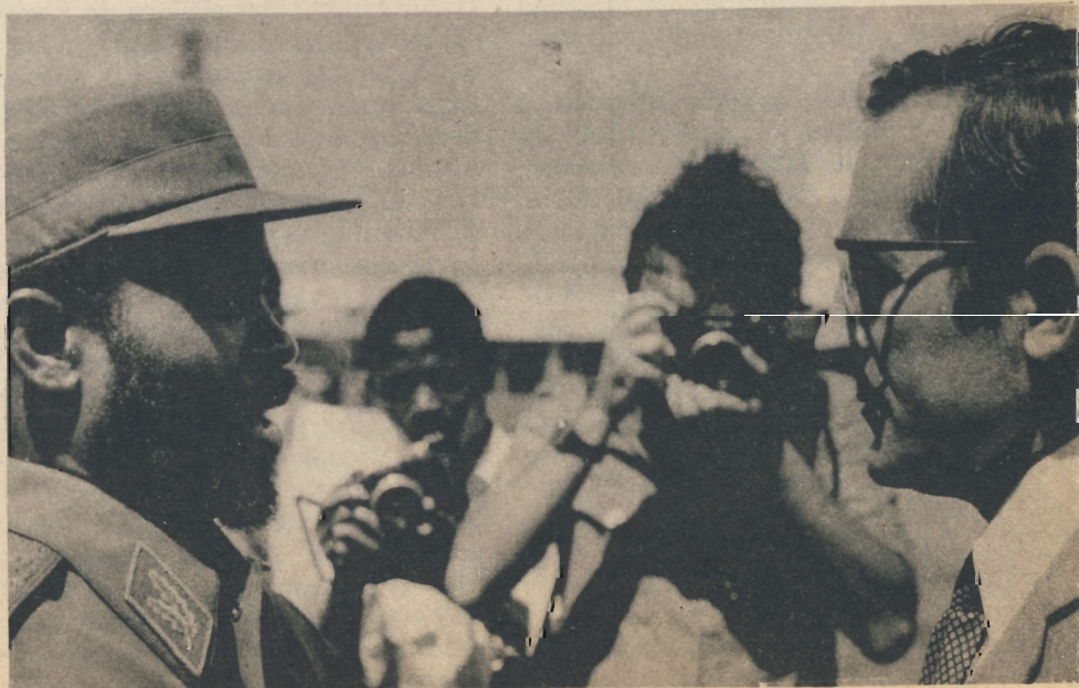
Momentos antes do embarque, quando os dois Chefes de Estado se saudavam em despedida