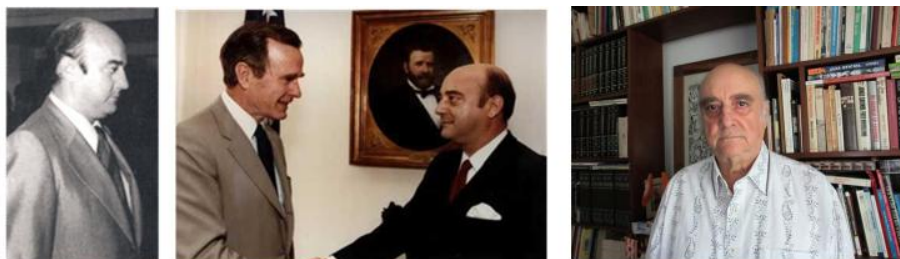
Fases de Jacinto Veloso: ministro da Segurança de Samora Machel e do SNASP; com George Bush (sénior); e atualidade.