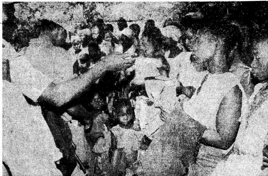
Mulheres e crianças libertadas pelas nossas Forças Armadas dos bandidos armados recebendo peças de vestuário das mãos de militares