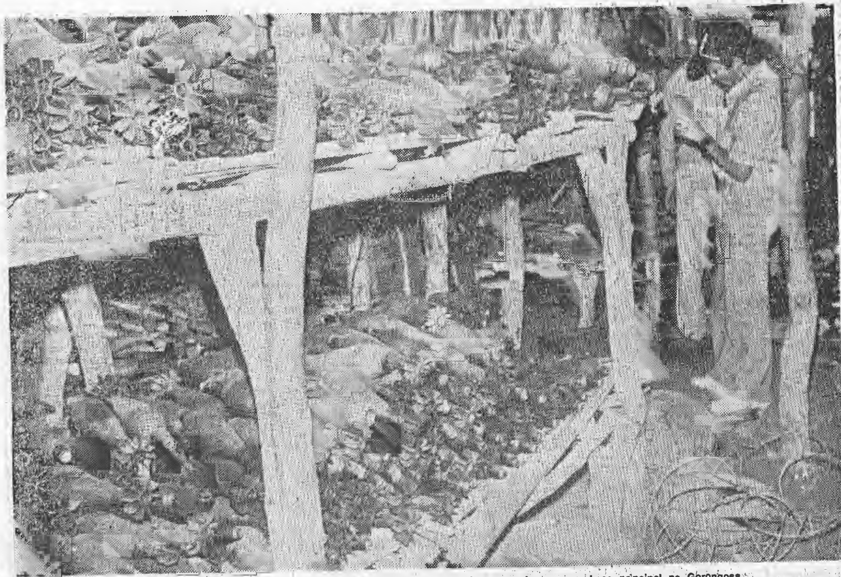
Um dos arsenais de granadas de morteiro, capturado aos bandidos armados na sua base principal na Gorongosa