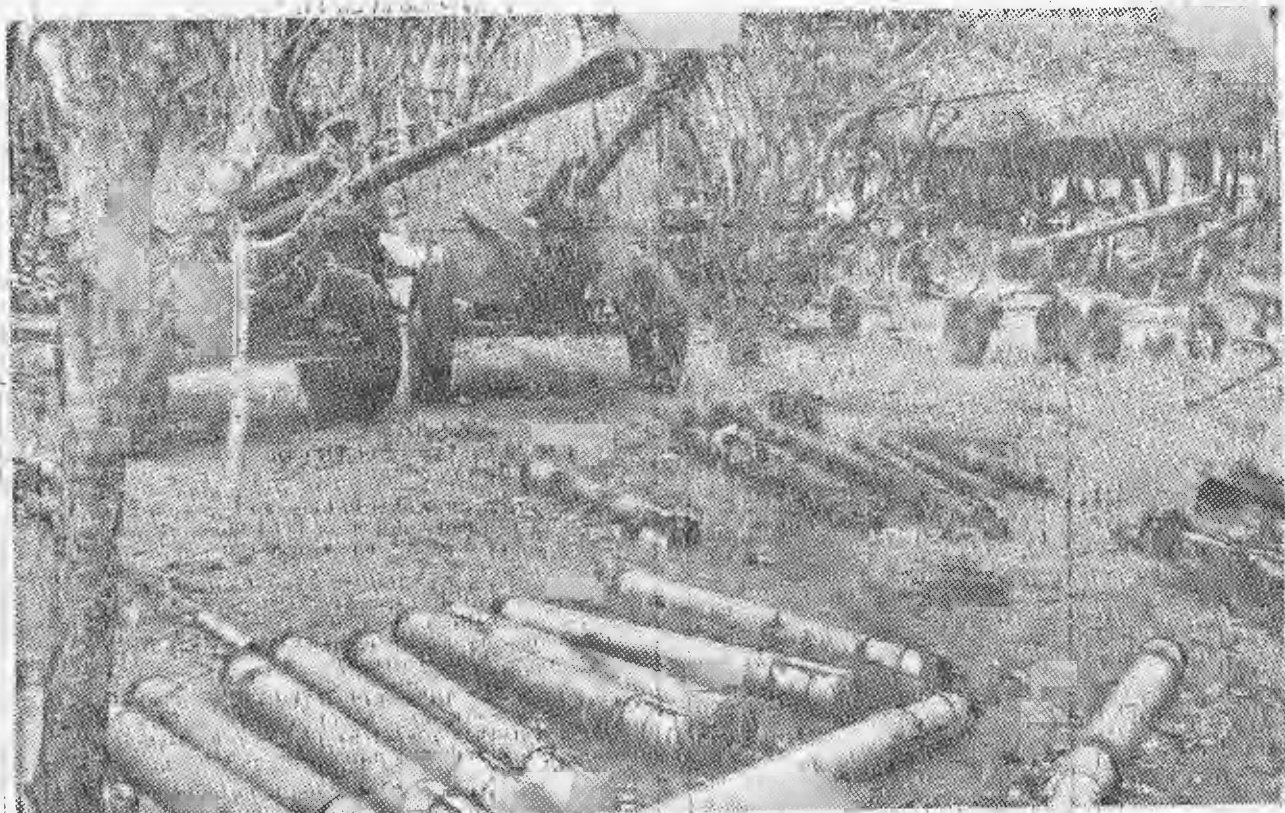
Peças de artilharia pesada que se encontravam na base principal dos bandos armados, tomada a 28 de Agosto 12/9/85 N. último