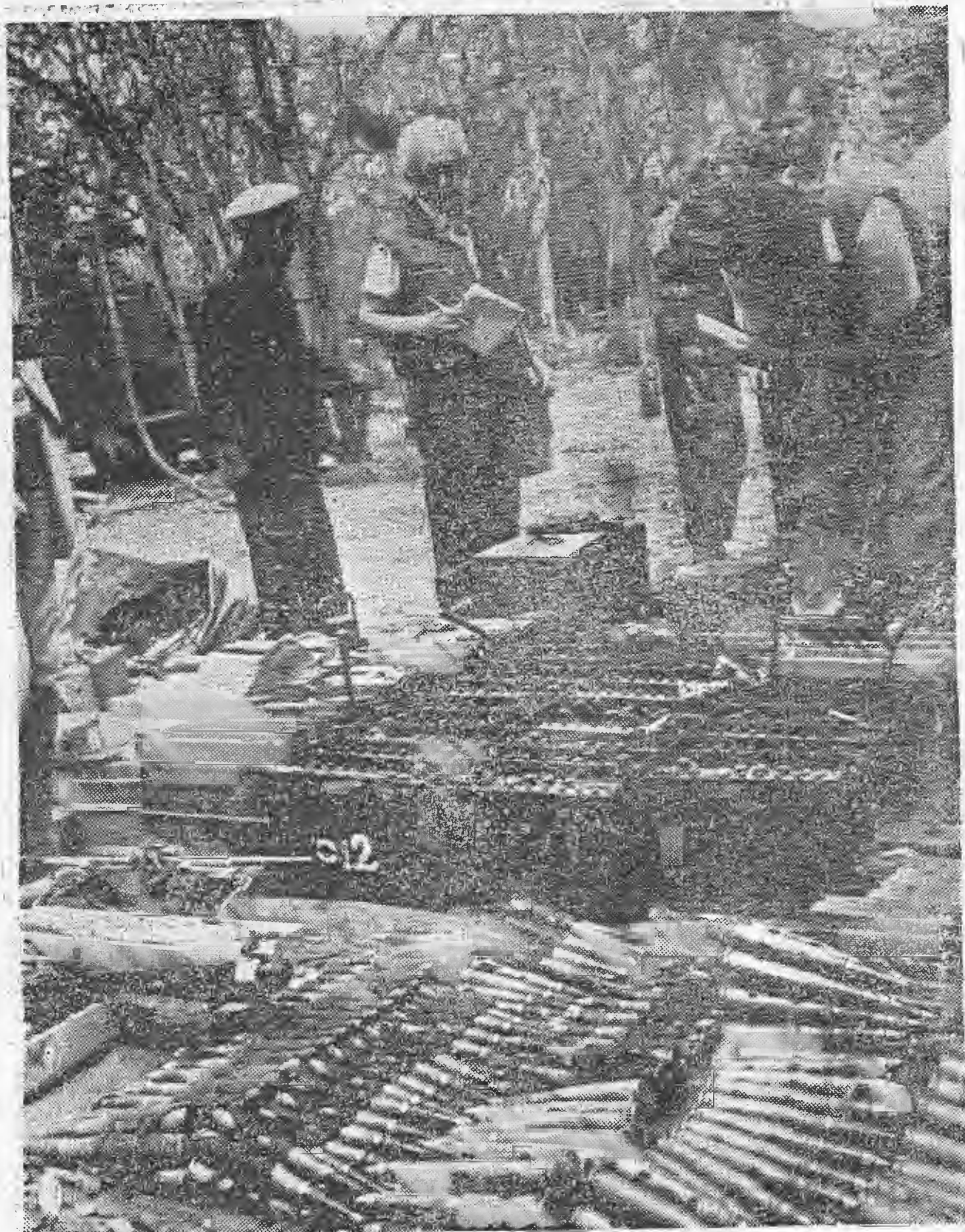
Os Jornalistas apreciando o conjunto de rádios emissores-receptores, alguns da marca SINCAL, durante a visita a «Casa Banana»