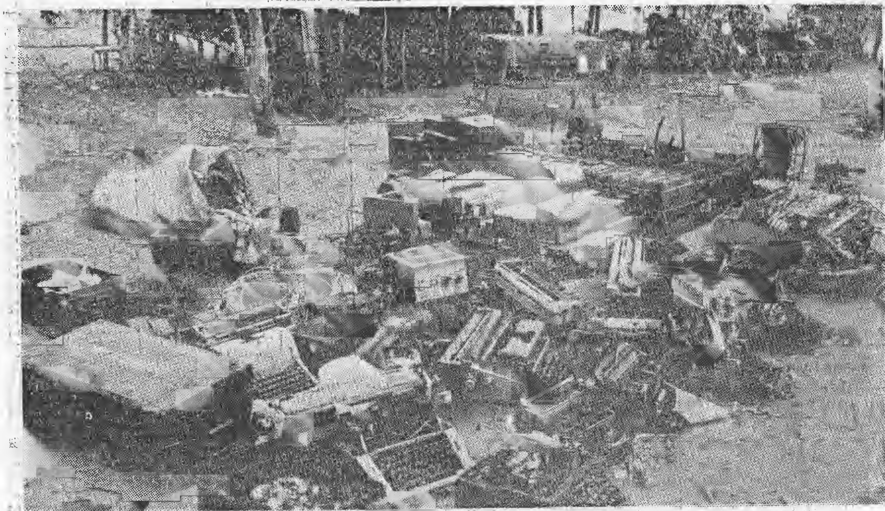
Em primeiro plano, podem-se ver diversas máquinas de escrever e uma caixa com moedas, encontradas na base principal dos bandidos armados na Gorongosa