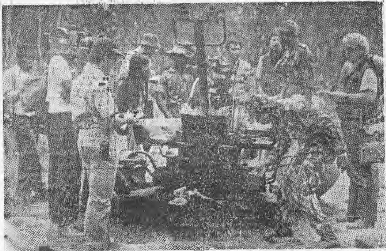
Uma peça ant-aérea capturada na operação da tomada da Gorongosa pelas forças militares conjuntas, sendo 12/9/85 N. apreciada por jornalistas que estiveram em «Casa Banana»