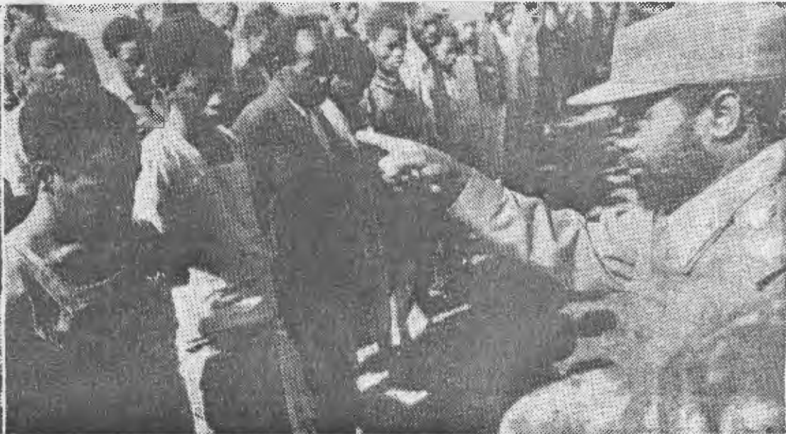
— Samora Machel dialogando com os bandidos. Ao lado, os criminosos e o material capturado pelas nossas Forças