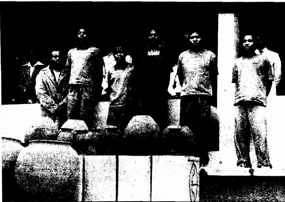
Alguns elementos dos bandos armados e indivíduos que tinham sido por eles raptados foram apresentados durante o comício